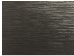
Relief Black KK95