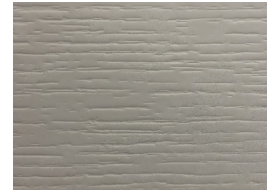
Groove Grey KK69

Nobilitati semplici per rivestimento interno cassetti: