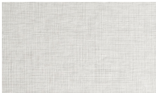
Penelope Bianco NPB

Placas en conglomerado ennoblecido por interior cajones