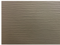
Relief Grey KK83