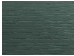
Groove Esmeralda KK39